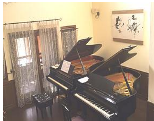
セミナー会場 シェモザー

内容：レッスン受講 1 回、全聴講、ファイナルコンサート出演、 さよならパーティー、オーディション料 ※ランチやディナー、ガーデンパーティー参加の場合は、別途お申込みください